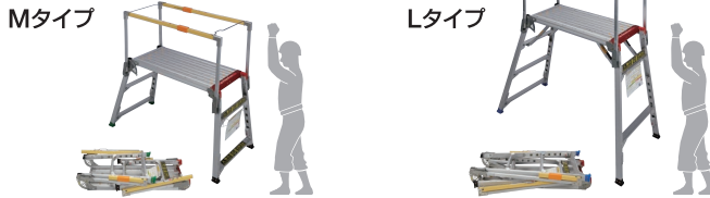
作業床寸法・本体仕様