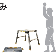
作業床寸法・本体仕様